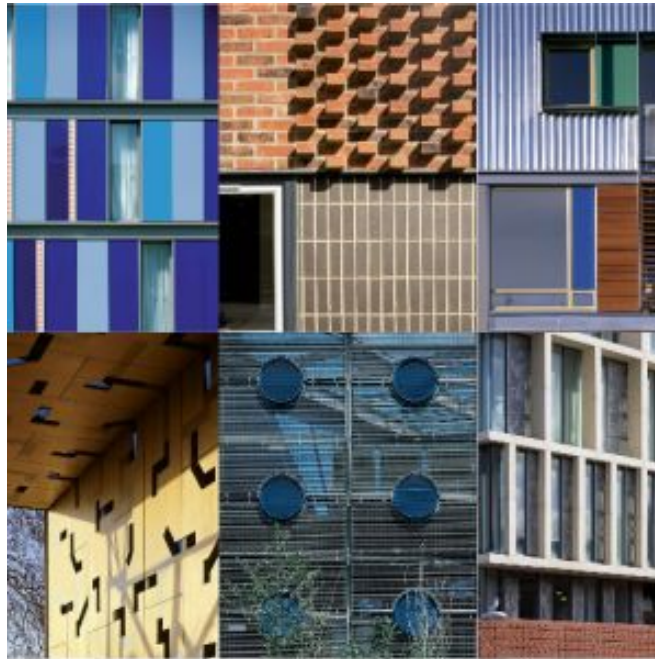
Figura 1. La didascalia deve essere numerata progressivamente e seguire la figura ed essere scritta in Times New Roman corsivo pt 9. Dopo la didascalia lasciare una riga vuota.